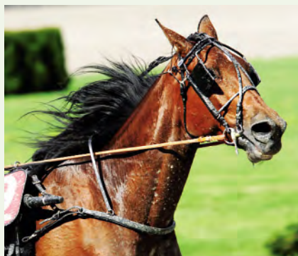
• Flicka Kronos.