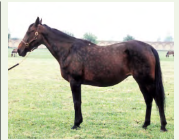
• Keystone Gwen.

– Det har snackats rätt mycket om den där affären, att det skulle varit riggad budgivning och så, men det var ett juste köp. Om någon bjudit högre än vår limit hade Pojke Kronos inte hamnat i vår ägo, avslutar Göran Blom. ■