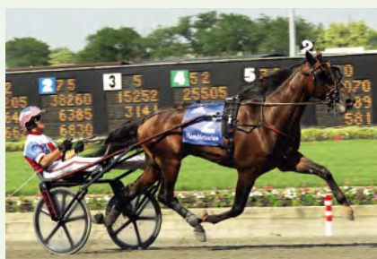
• Donato Hanover.